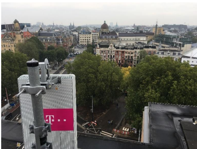
Figuur 1. 5G antenne van T-Mobile / Huawei op het Leidseplein te Amsterdam. De MIMO antenne met '3D-beamforming' technologie werkt in de 2600 MHz (bandbreedte 20 MHz). Mensen die daar lopen met een 5G-smartphone worden persoonlijk aangestraald en gevolgd door hun 'privé' bundel.

5G is een denkmodel dat ons van bovenaf wordt aangepreacht ('top down'). De verwachting is dat dit op grote schaal frictie zal geven. Niet in het minst omdat de huidige systemen, die voornamelijk gebruik maken van 3G en 4G technieken, voor bijna alle burgerlijke toepassingen best goed werken en weinig te wensen overlaten qua betrouwbaarheid en snelheid. Tenslotte geeft de 5G technologie en extra belasting van ons incasseringsvermogen, omdat de verwachte hinder komt bovenop de hinder van de nu gebruikte communicatietechnieken.